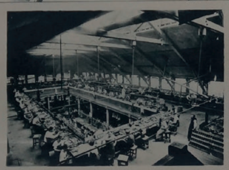
LUTHERIE & PIANOS