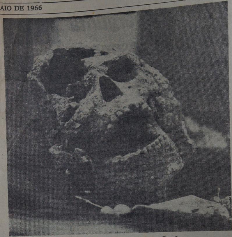
"Miss Sambaqui" o crânio mais antigo encontrado no Brasil