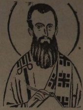
SANTOS DA UNIDADE: CIRILO DE JERUSALÉM, EFREM DA SIRIA E ESTEVAO DE PERSEM