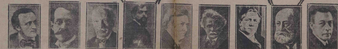
Ricardo Wagner "um benefício sonoro para o mundo musical".

O que os primeiros músicos de fama universal escrevem com referencia ao piano "BECHSTEIN":