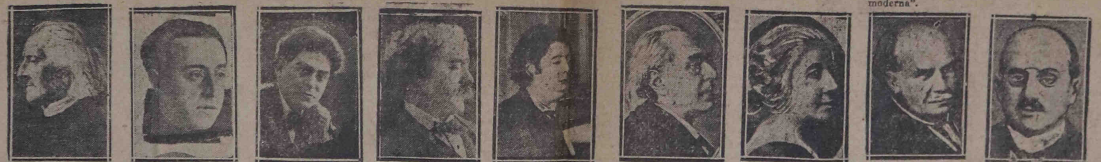
Franz Liszt "um juízo sobre os pianos Bechstein sempre será um aplauso incondicional de sua completa perfeição. Desde 25 anos toco exclusivamente as mais diversas que possam alcançar vamente nos pianos Bechstein que soube que a fabrica Bechstein te".