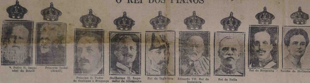
Pedro II, Imperador do Brasil